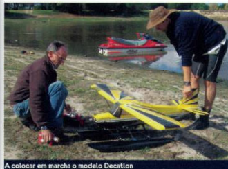
A colocar em marcha o modelo Decathlon