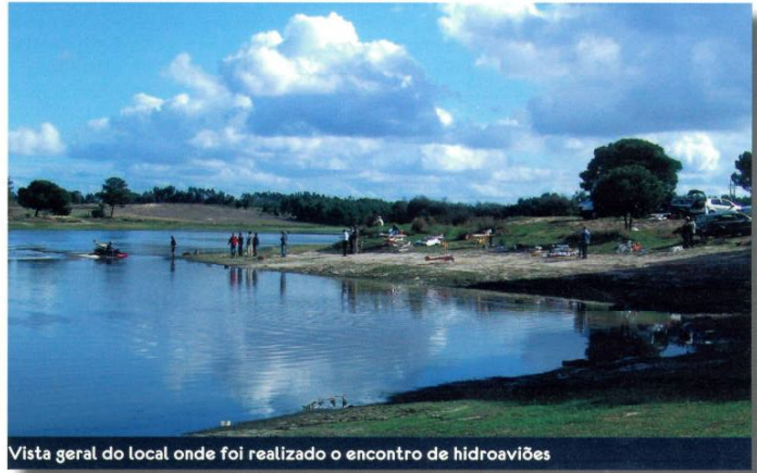
Vista geral do local onde foi realizado o encontro de hidroaviões

As fases de taxiagem, descolagem e amarragem são sempre mais traiçoeiras em superfícies de água, tornando-se pertinente um meio de resgate dos modelos. Para este efeito, foi disponibilizado, por um dos associados, uma mota de água para retirar da água os modelos que se imobilizavam devido à paragem dos motores no meio da barragem, ou que simplesmente teimavam em adoptar posições típicas